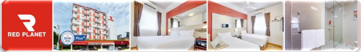
ตามอัธยาศัย)

จากนั้นให้ทุกท่านเดินทางเข้าสู่โรงแรมที่พัก-เช็คอิน แล้วพักผ่อนตามอัธยาศัยที่ Red Planet Hotel https://www.redplanethotels.com/th/ สะดวกสบายเดินไปชายหาดพัทยาได้ใน 5 นาที หรือจะไปเดินเล่นช้อปปิ้งให้เย็นฉ่ำใน Central Marina ก็เพียงแค่ข้ามถนนไปก็ถึงแล้ว (อาหารค่ำอิสระ